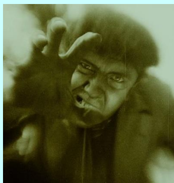
Le géant de la forêt L’Horloge magique , 1928